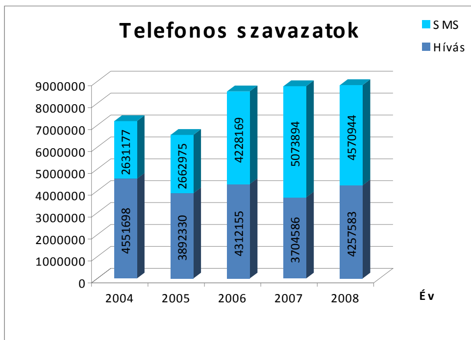
1. ábra: A televíziós szavazás alakulása, hívások és SMS-ek aránya